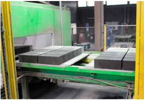
Figure: BFT International