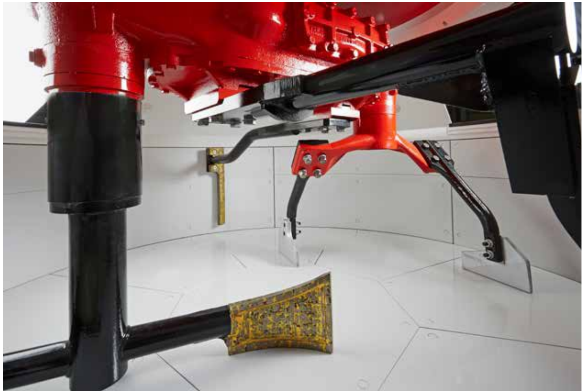
Figure: Teka Maschinenbau