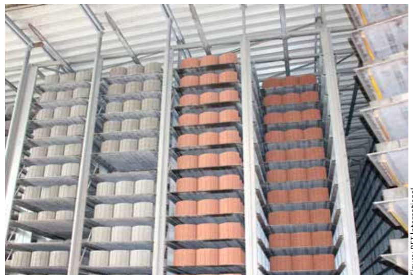
Figure: BFT International

... in allen erdenklichen Farben und Formaten