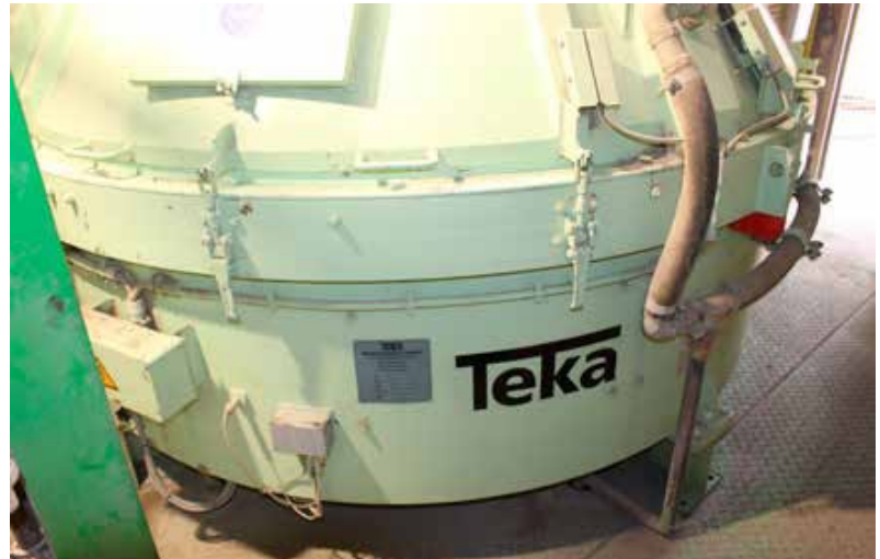
Figure: BFT International

Another reason why the company Ehl decided on a Teka turbine mixer was because this machine type has another advantage over some other mixer types: i.e., the possibility of processing absolute small amounts and minimum quantities. Here, according to the manufacturer, the turbine mixer really comes into its own. Teka turbine mixers are mainly in operation where different and high-quality products are manufactured, and there-